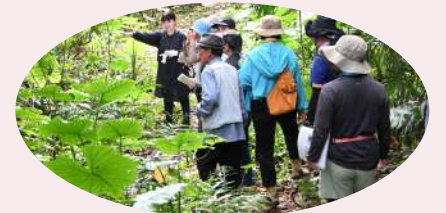
昨年度石垣島受講者