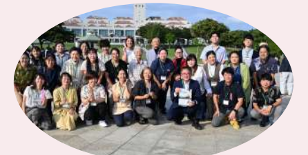
昨年度沖縄本島受講者